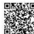
LINE 神奈川県療養 サポート

右のQRコードを読み取りLINE「神奈川県療養サポート」の友だち登録をお願いします。 登録翌日から1日1回7時30分～9時頃にメッセージが届きますので、健康状態(体温など)を毎日必ず回答してください。